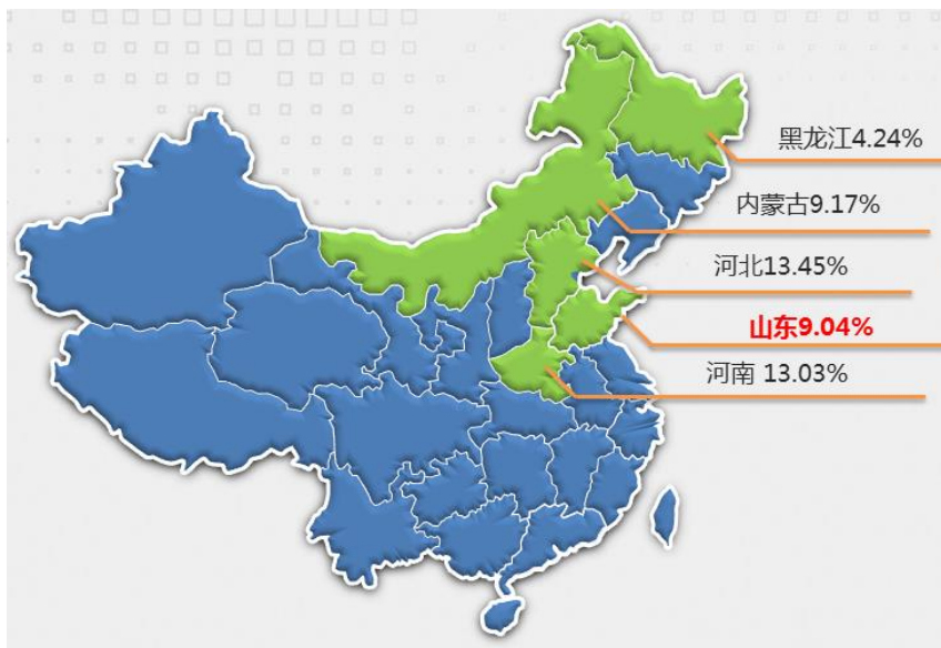
我国乳制品制造业主要分布区域

全国生鲜乳主产区主要分布在北方如河北、河南、内蒙、黑龙江、山东等省份。其液态乳产量超过 100 万吨的省份有河北、河南、内蒙、山东、黑龙江等，其中山东省占到 9.07%，位于全国鲜乳产量第四位。山东省不仅有伊利、蒙牛等大型乳品企业下属的子公司，还有如得益、佳宝、益膳房、百惠、圣元等众多本省企业，岗位需求量大。