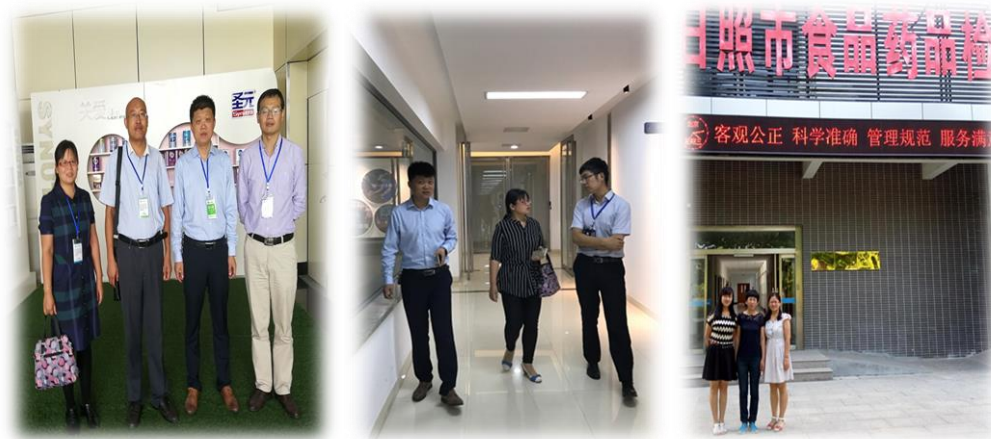
教师赴得益、圣元、食品药品检测等相关行业企业调研

本课程多年来与得益乳业有限公司、青岛圣元营养食品有限公司、益膳房乳业有限公司、宜生牧业集团、日照市食品药品检验检测中心等行业企业长期合作，共同建设。通过行业企业调研，教师顶岗锻炼，以及引入行业企业具有丰富工作经验和操作技能的专家和技师，共同讨论制定课程标准，课程教学模式，课程内容的选取与设计以及教学资源的开发和建设，使人才培养目标与企业需求领对接，助力学生的岗位适应和职业成长，同时，也可以满足行业企业顺利开展员工培训，提升员工技能和素质的需求，达到产教融合，合作共赢的目的。