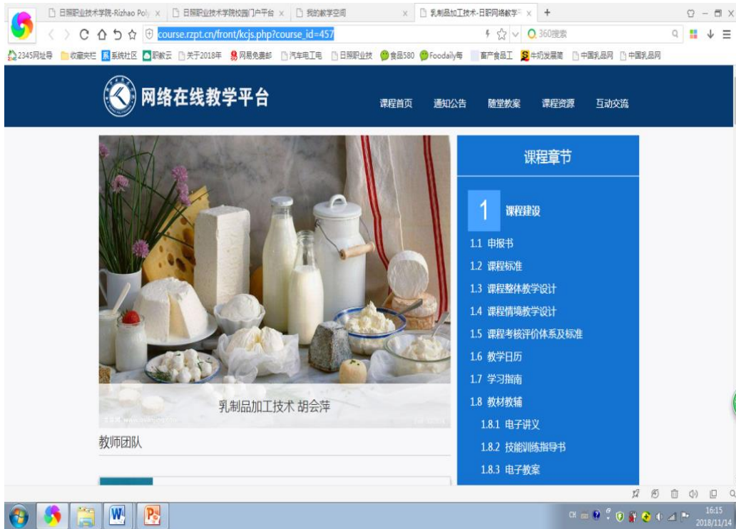
日照职业技术学院网络教学平台