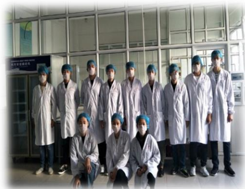
心益乳品工作室成员